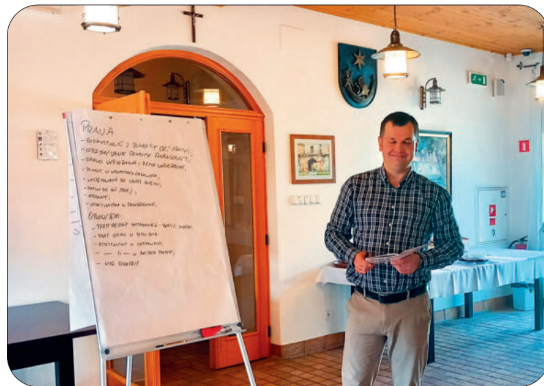
Wiśniowa, 5-6.10.2023 r. Szkolenie podstawowe dla działaczy