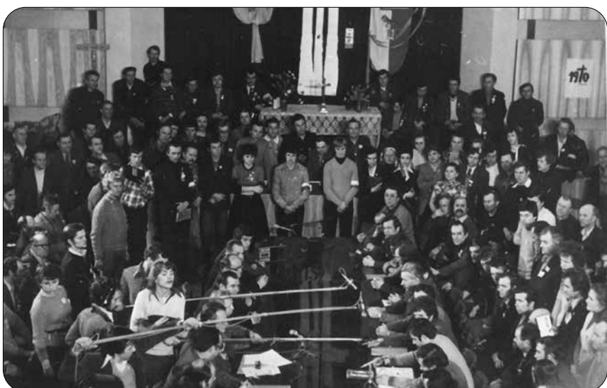
Spotkanie z komisją rządową

Każdego kto zechce pomóc prosimy o wpłaty na konto Regionu Rzeszowskiego NSZZ „Solidarność” nr 96 1240 1792 1111 0000 1973 9078 z dopiskiem “witraż”.