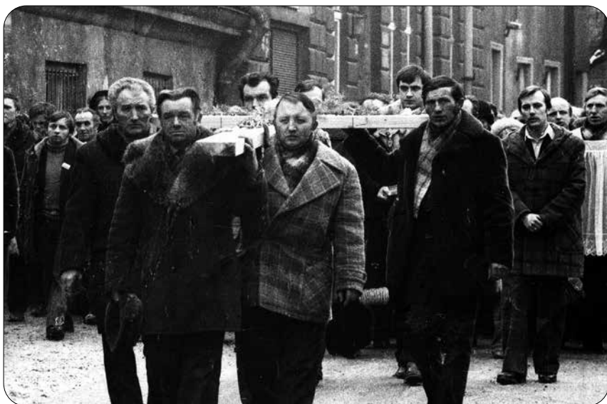
Przemarsz ulicami Rzeszowa

W nocy z 18 na 19 lutego 1981 roku w budynku rzeszowskiego „Domu Kolejarza”, będącego wówczas siedzibą byłej Wojewódzkiej Rady Związków Zawodowych, przedstawiciele komisji rządowej, reprezentujący najwyższe władze PRL, podpisali z przedstawicielami Komitetu Strajkowego, działającego w imieniu Ogólnopolskiego Komitetu Założycielskiego NSZZ Rolników Indywidualnych „Solidarność” oraz z przedstawicielami „Solidarności” pracowniczej porozumienie.