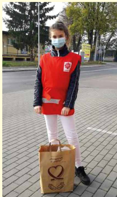
Pociechy członków „Solidarności” chętnie włączyły się w akcję niesienia pomocy

ubogiego ”. Nie byłaby możliwa, gdyby nie darczyńcy i wolontariusze. W imieniu obdarowanych, gorąco dziękujemy.