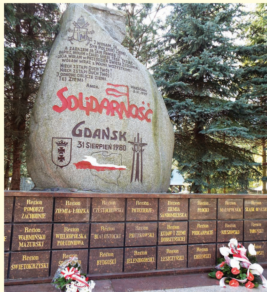
Pielgrzymujący związkowcy z naszego Regionu tradycyjnie kwiaty składają pod pomnikami NSZZ „Solidarność”, bł. ks. Jerzego Popiełuszki i Jana Pawła II

Zarząd Regionu Rzeszowskiego NSZZ „Solidarność” organizuje każdego roku (w przedostatnią sobotę i niedzielę kwietnia) wyjazd na Ogólnopolską Pielgrzymkę „Solidarności” do Sanktuarium Matki Bożej Bolesnej Królowej Polski w Licheniu.