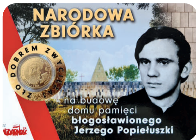
Powstaje Muzeum Patrona „Solidarności”

tylko w polityce. W oświacie też się kotłowało. Religia weszła do szkół. Po raz pierwszy nauczyciele wyruszyli na szlak pątniczy 12 lipca 1993 roku. To wtedy zarysowały się dwa nurty wędrówki: formacyjny i dydaktyczny. Na rekolekcyjnym szlaku dzielili się swoimi doświadczeniami, obawami i sugestiami dotyczącymi przyszłości polskiej oświaty.