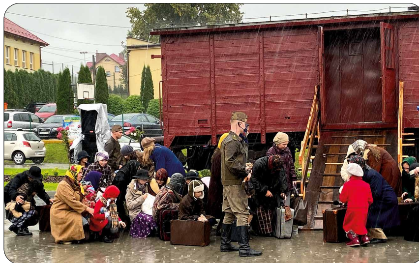
Uczestnikami spektaklu byli uczniowie i pracownicy szkoły, rodzice z małymi dziećmi, babcie z wnukami i grupa pododdziału Strzelców

17 września 2021 roku w Nawsiu koło Wielopola Skrzyńskiego upamiętniono Sybiraków. Obok Szkoły Podstawowej im. Sybiraków powstał park pamięci poświęcony zesłańcom. Na uroczystość otwarcia zaproszona została rzeszowska „Solidarność”.