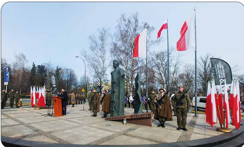
W 2013 roku przy alei Łukasza Cieplińskiego pomnik upamiętniający członków IV Zarządu Zrzeszenia „Wolność i Niezawisłość”