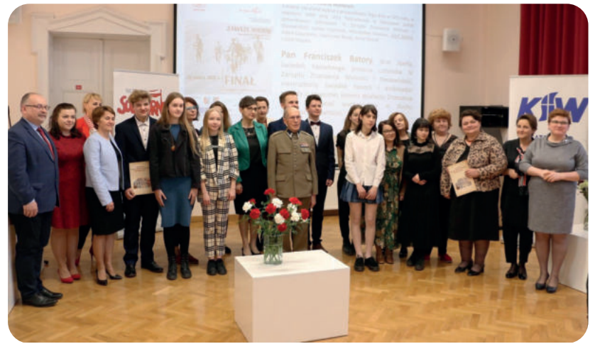
Tegoroczne zmagania uczestników odbyły się w cieniu wojny na Ukrainie. Laureaci konkursu 2022 i zaproszeni goście na pamiątkowej fotografii

24 marca w PCEK w Ropczycach odbył się uroczysty finał VII edycji Wojewódzkiego Turnieju Poezji i Prozy Zawsze Wierni. Należy nadmienić, że patronat honorowy nad konkursem pełni Prezydent RzP Andrzej Duda oraz Region Rzeszowski NSZZ Solidarność – od początku jego organizacji, fundując również nagrody zwycięzcom. Tegoroczne zmagania miały szczególny charakter. Słowa tekstów poetyckich i prozatorskich prezentowanych przez uczestników gali, brzmiały niezwykle przejmująco. Trwająca w Ukrainie wojna pozostawiła swój niemy ślad też tutaj.